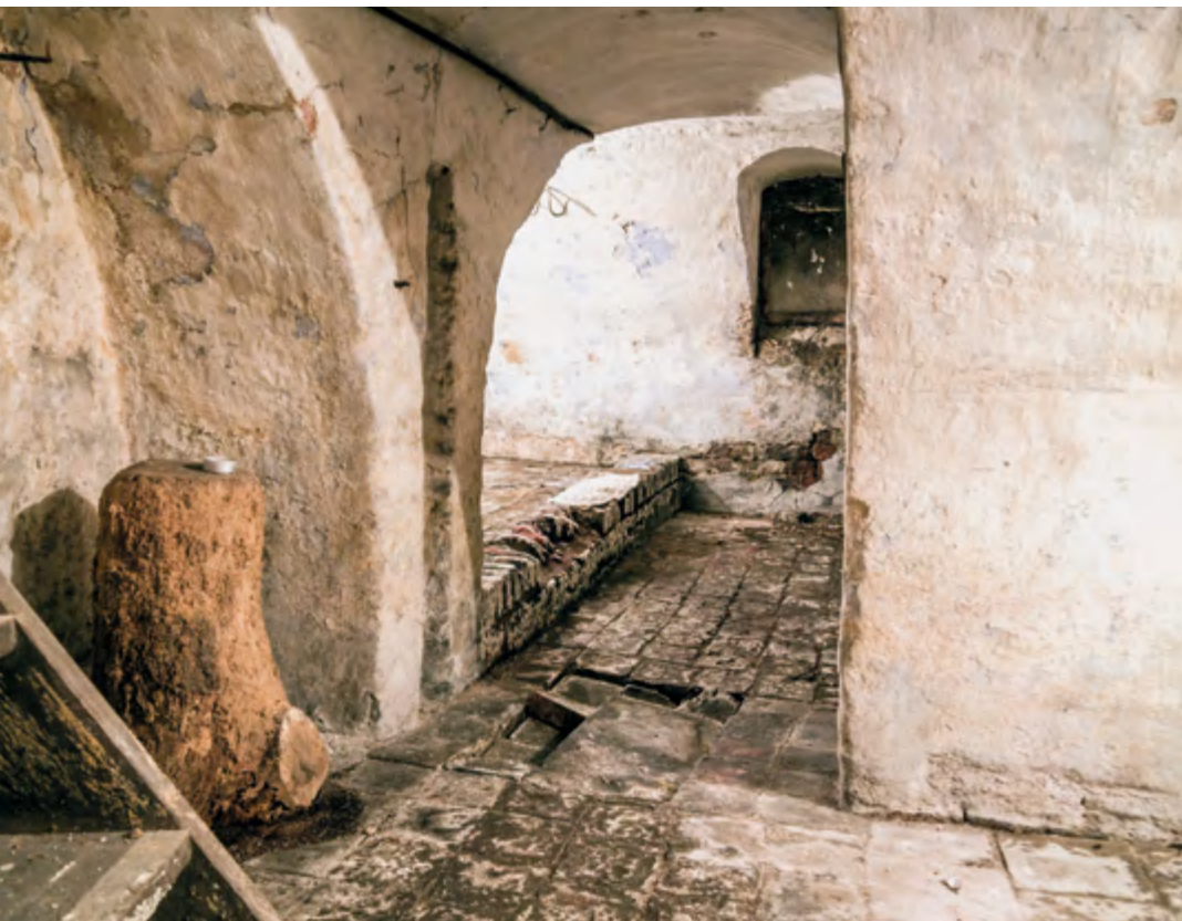
Blick aus dem Vorraum in den Raum mit der Mikwe

jüdischen Gemeinde ein Grundstück zum Bau der neuen Synagoge gegen einen geringen Pachtzins auf 99 Jahre zur Verfügung gestellt. Bereits am 18. August desselben Jahres konnte das neue Gotteshaus feierlich geweiht werden.