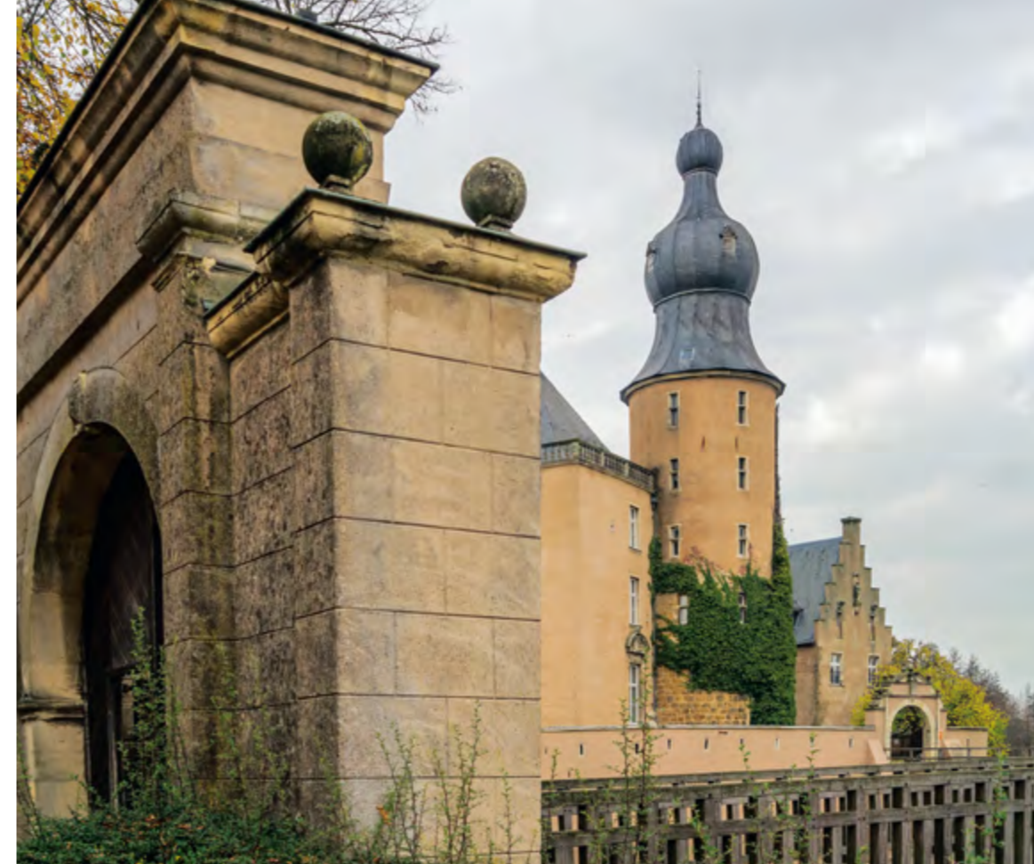
Zugang zur Jugendburg Gemen von der Gemener Freiheit aus

Ausgangspunkt für diese gelebte Form der Toleranz war