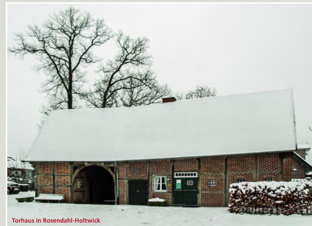
Torhaus in Rosendahl-Holtwick

In der romantischen, weihnachtlich geschmückten Schlosskapelle in Velen werden an allen vier Adventswochenenden Hörspiele und Hörbücher für Kinder, Erwachsene und die ganze Familie dargeboten. Jeweils samstags und sonntags gibt es zwischen 12 und 18 Uhr in historischem Ambiente traditionelle, heitere und moderne Weihnachtsgeschichten von großen Autoren wie Charles Dickens, den Brüdern Grimm, Hans Christian Andersen, Robert Walser oder Gaby Hauptmann und prominenten Erzählern wie Senta Berger, Katharina Thalbach, Peer Augustinski und Rolf Becker. Der Eintritt ist frei. – Im Anschluss an das Hörerlebnis laden das Schlossrestaurant und die Weihnachtshütte im Schlosshof zur adventlichen Kuchentafel, zu Glühwein und winterlichen Spezialitäten ein.