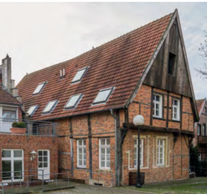
Das Haus der Familie Stein in der Münsterstraße in Billerbeck

In anderen Orten mit einer kleineren jüdischen Gemeinde wurden anstelle von Synagogen in privaten Häusern Beträume errichtet – so zum Beispiel in Billerbeck in der Münsterstraße 2, dem ehemaligen Haus Stein-Bendix. Obgleich der Betraum in der Form eines Kellergewölbes noch erhalten ist, wird er heute anderweitig verwendet und kann derzeit nicht besichtigt werden.