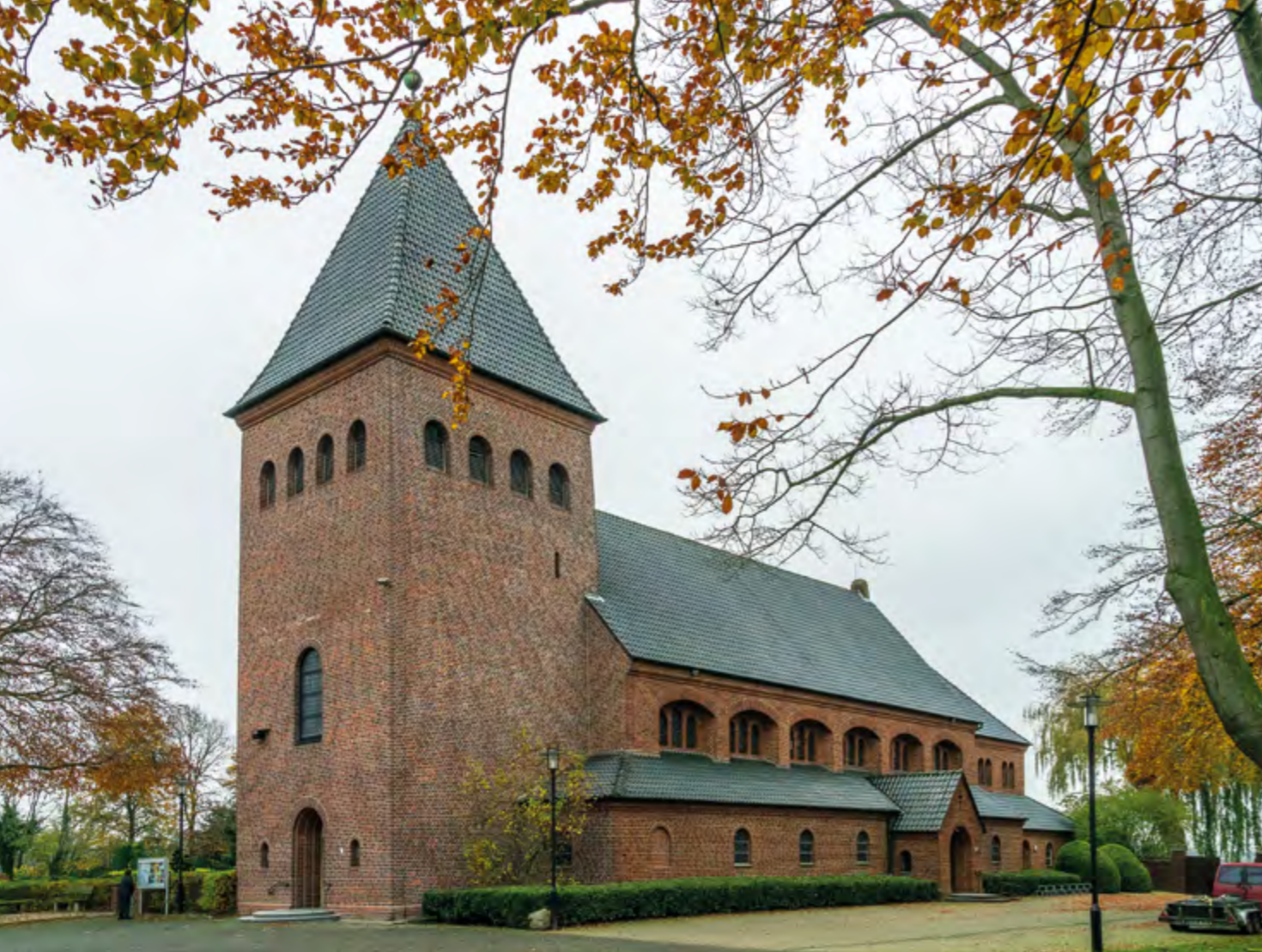
Heilig-Kreuz-Kirche in Borkenwithe

Doch wenn dann das »Gloria in excelsis Deo« erklang, überflutete plötzlich warmes und helles Licht den Kirchenraum.